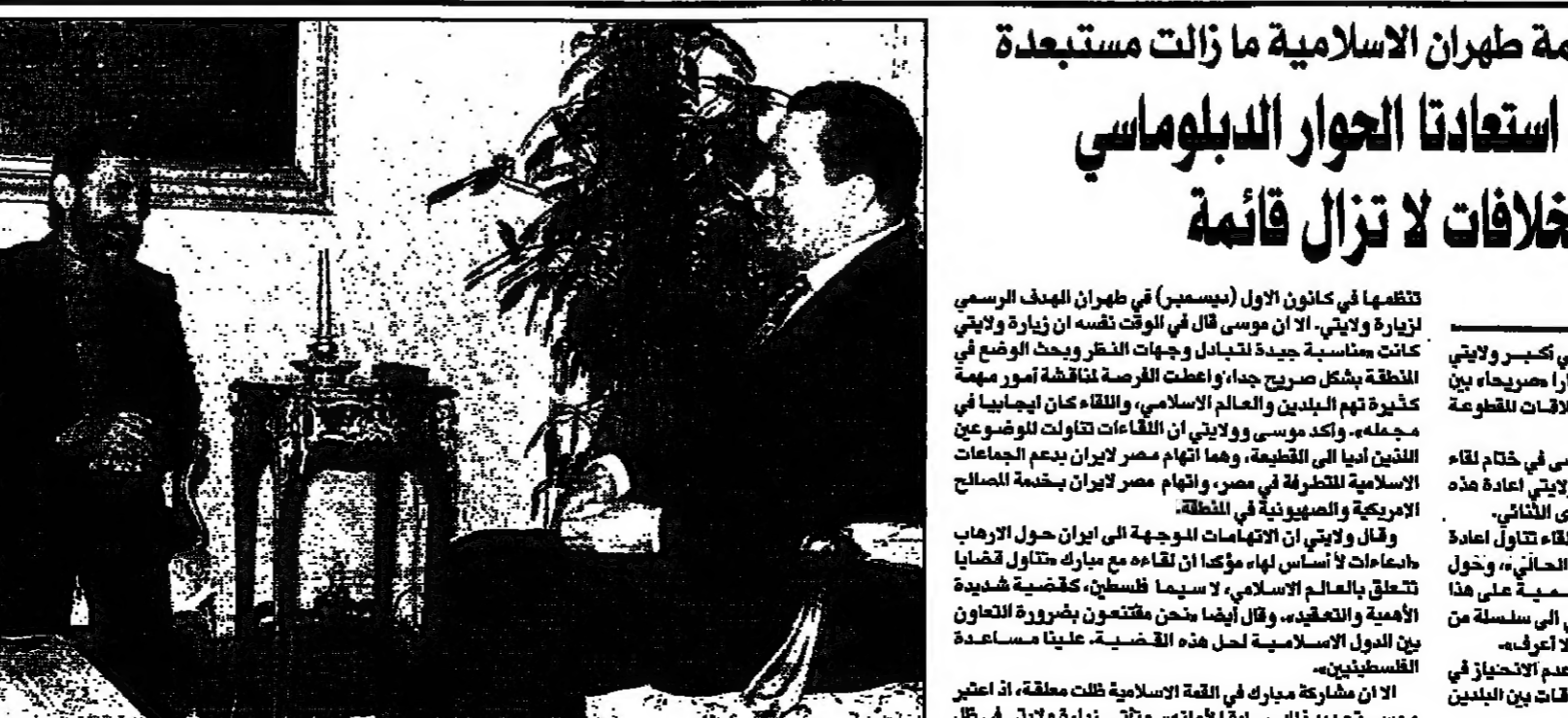
الرئيس حسني مبارك أثناء استقباله على كبرى ولايتي وزير خارجية إيران في القاهرة حيث تسلم دعوة لحضور القمة الإسلامية المقبلة في جوبا

القاهرة - من منى سالم: لكن الخلافات لا تزال قائمة بين مصر وإيران بشأن القضايا الإسلامية.